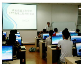
我校中兴通讯LTE助理工程师开班