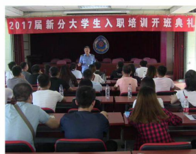
我校毕业生参加中国铁路乌 鲁木齐铁路局员工入职培训