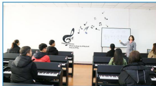
电钢琴即兴伴奏教学

实训中心设有：舞蹈创编室、电钢琴教学教室、美术及手工实训室、幼儿教育活动综合实训室、卫生保育实训室、奥尔夫音乐教育实训室、蒙台梭利教育实训室等；实训基地包括校内实训基地—西安交通工程学院附属幼儿园及省市级校外实训基地15余家。