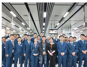
我校毕业生在杭港地铁工作