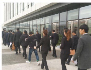
我校毕业生赴成都地 铁运营公司上岗实习