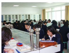
我校学生在会计事务 所进行会计真账实训