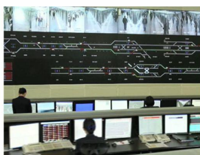
我校在杭州地铁从事行 车组织工作的毕业生