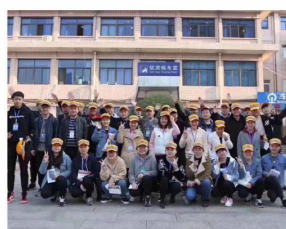
我校学生在西安铁路 局辖内各车站实习