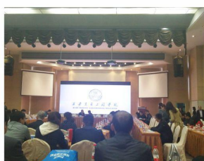
我校协办中国城市轨道交通 人力资源建设研讨会