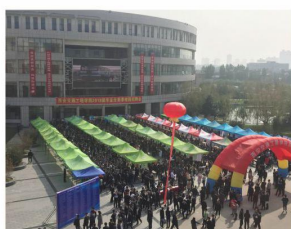
校园招聘会很盛况