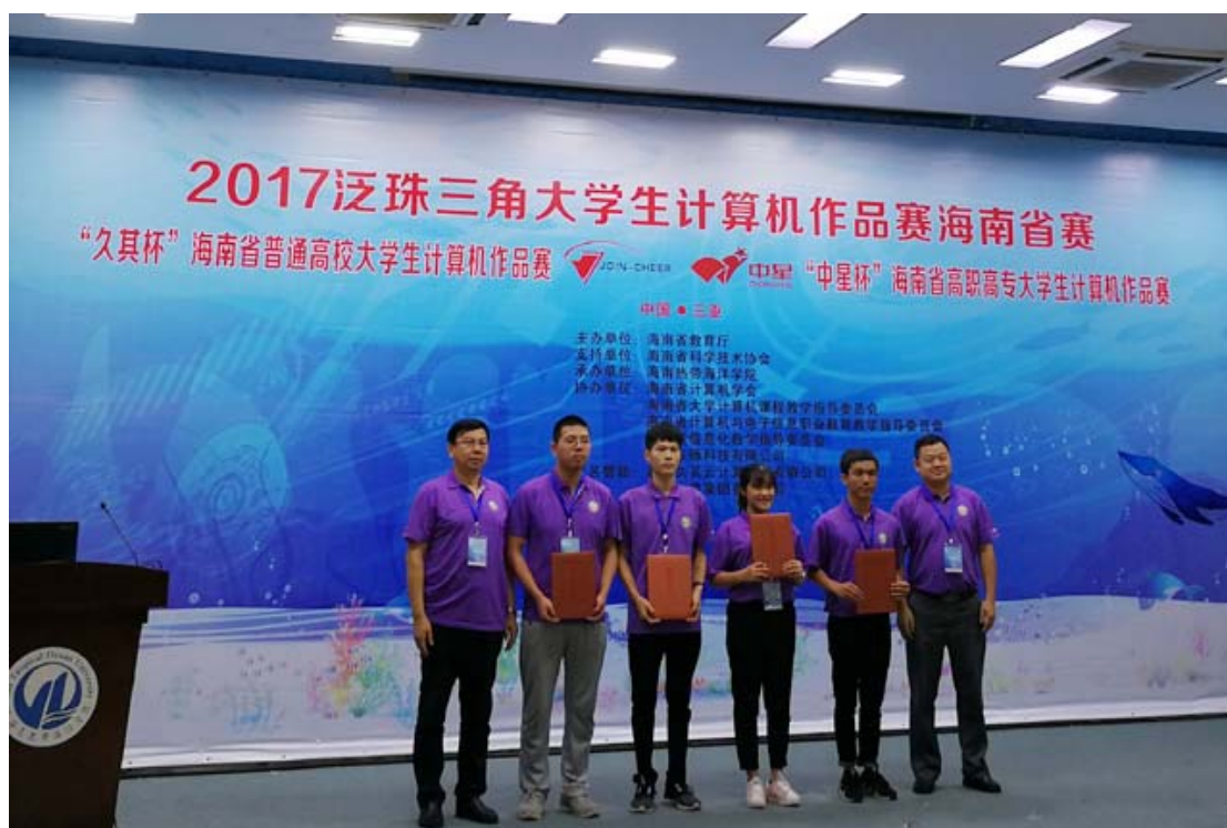
我院学生在 2017 泛珠三角大学生计算机作品赛海南赛区比赛中荣奖一等奖