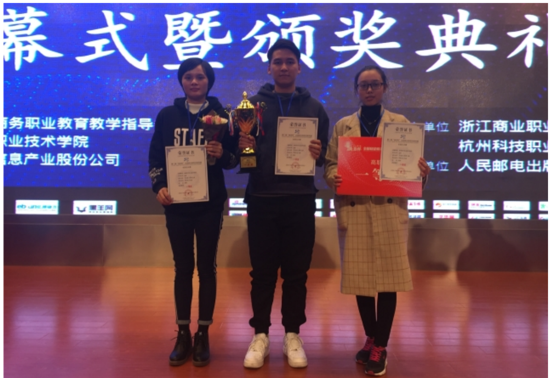
我院学生荣获第二届“奥派杯”全国移动商务技能竞赛高职组全国一等奖

学院不断创新人才培养模式，人才培养质量稳步提高。学院坚持实施“实践主导，能力本位，校企合作”人才培养模式，通过积极组织学生参加各类职业技能大赛，加强学生专业技能的培养，做到以赛促教、以赛促学、以赛促改、以赛促建，以赛促检教，不断创新教学模式，深化产教融合、校企合作，提高了人才培养质量，推动学院科学发展。